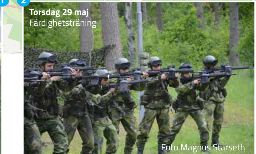
Torsdag 29 maj Färdighetsträning