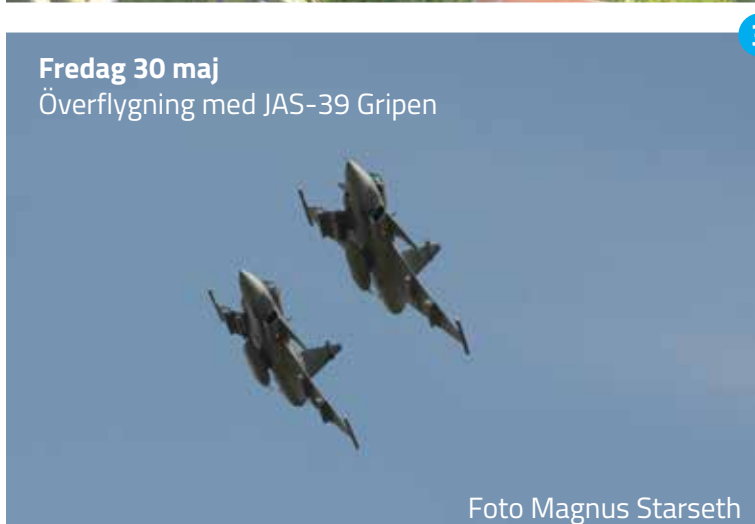
Fredag 30 maj Överflygning med JAS-39 Gripen