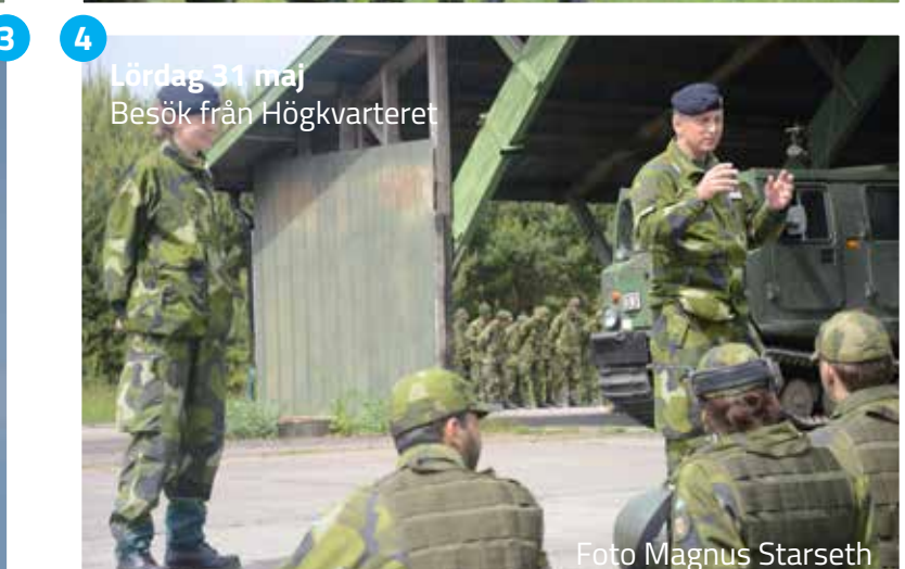
Lördag 31 maj Besök från Högkvarteret