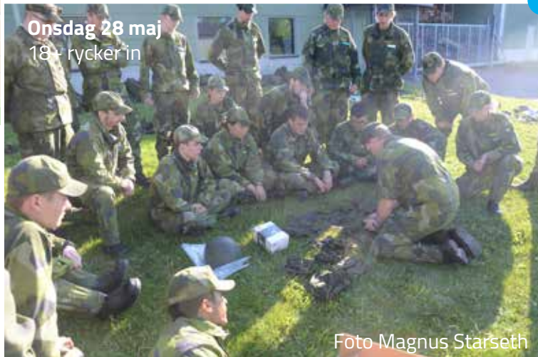
Onsdag 28 maj 18+ rycker in